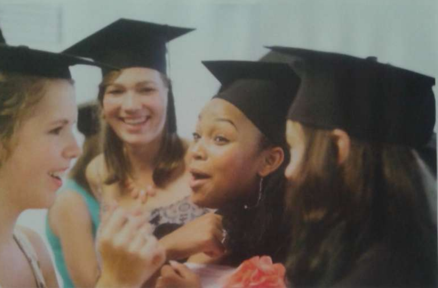
DE NEIGING DE LAT HEEL HICHS TE LEGGEN MAAKT DE GRENZELIJZE GENERATIE NIET PER SE GELUKKIG