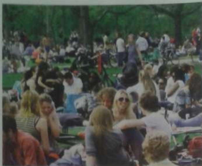
MENSEN DENKEN DAT JONGEREN AL YOLOËND DOOR HET LEVEN GAAN